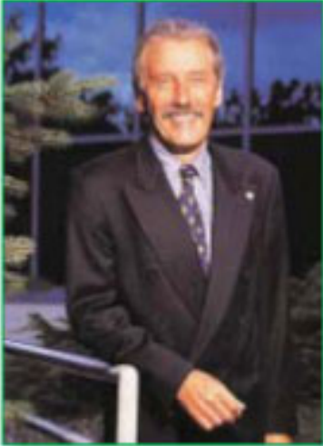
Ernst & Young LLC Master Entrepreneur of The Year®